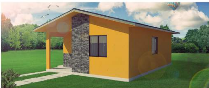
Perspectiva Frontal de la Vivienda