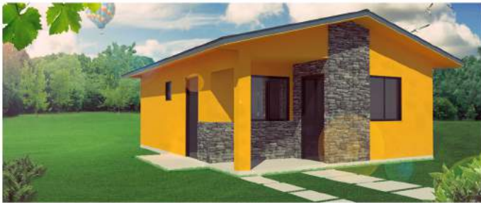
Perspectiva Frontal de la Vivienda