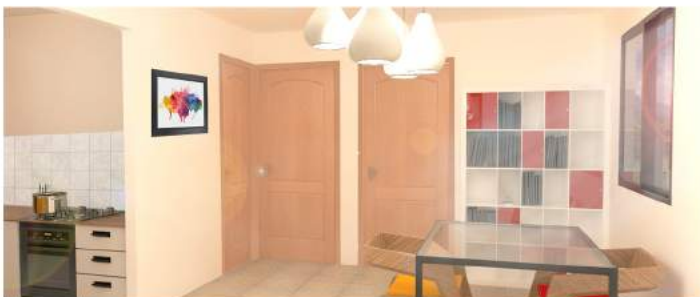
Perspectiva interior de la Vivienda

Se trata de una vivienda de 50m 2 , distribuidos en dos dormitorios y un gran espacio de salón-comedor y cocina. El baño está aparte. Dispone además de porche de entrada cubierto. Usamos el Sistema Constructivo de Steel Frame con acabado de panel de silicato de calcio pintado y teja asfáltica en cubierta.