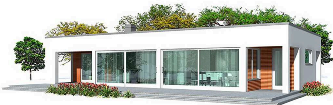
Perspectiva de la Vivienda