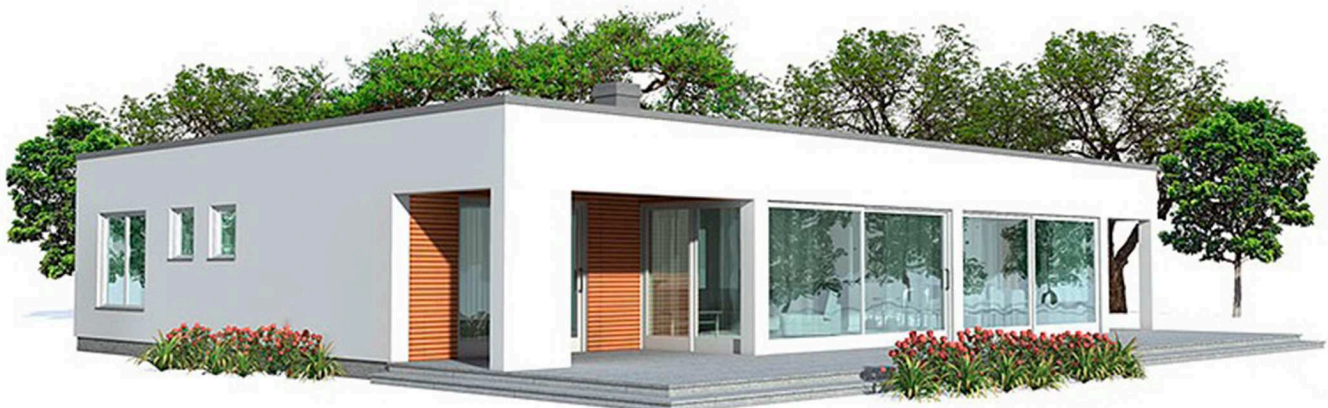
Perspectiva General de Vivienda