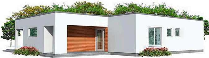
Perspectiva de la Vivienda